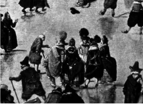
Details uit Winterlandschap (rond 1608) van Hendrick Avercamp.

hoepelrok en hoge pruik, de heren met struisveren op hun hoed. Een grauwe bedelaar probeert hen tot medelijden te bewegen, maar ze tonen geen enkele interesse. Wat doen ze daar op het ijs in een of ander dorp, zo zonder koets en zonder bedienden? Hoe zijn ze daar gekomen? Wat doen al die mensen trouwens op het ijs? Er wordt geen feestgevierd, het is geen Kerstmis of carnaval, het is geen zondag – de kerk staat duister en leeg op de achtergrond.