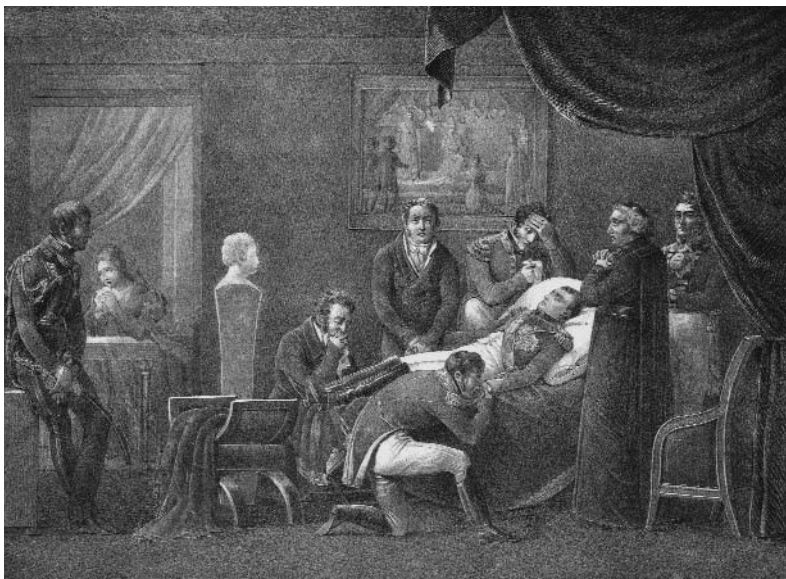
De dood van Napoleon, 5 mei 1821 (anonieme maker).

omschreef de algehele malaise in een treffende metafoor: ‘Holland was slechts het uitvloeisel der Fransche rivieren, een stuk afgespoelde Fransche modder’. 7