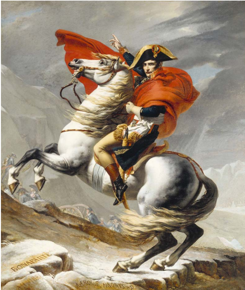
Napoleon trekt de Alpen over in mei 1800, geschilderd door Jacques-Louis David.

De auteurs van Napoleons nalatenschap laten zien hoe de Franse keizer voortleeft in de Nederlandse samenleving en waarom hij zich ook in Nederland onsterfelijk heeft gemaakt.