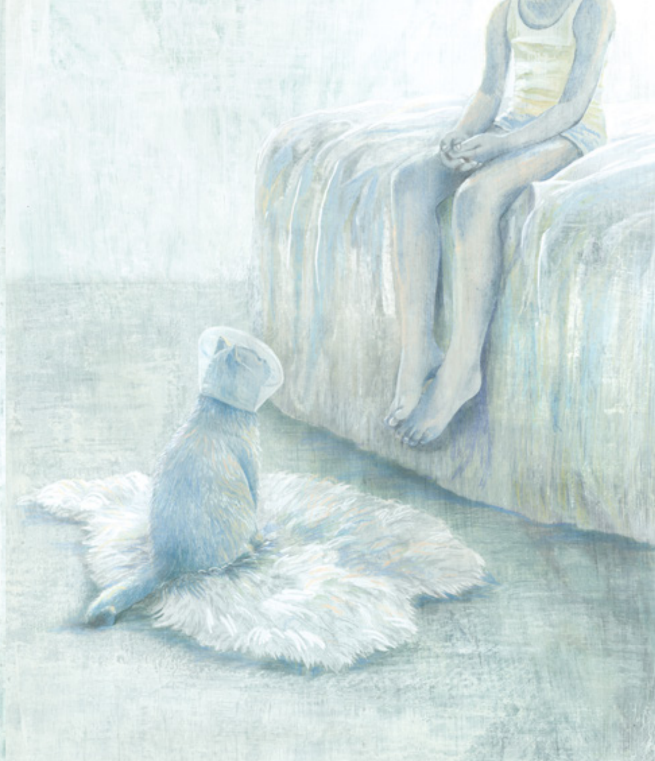
Kleine witte dieren en grote witte dieren.