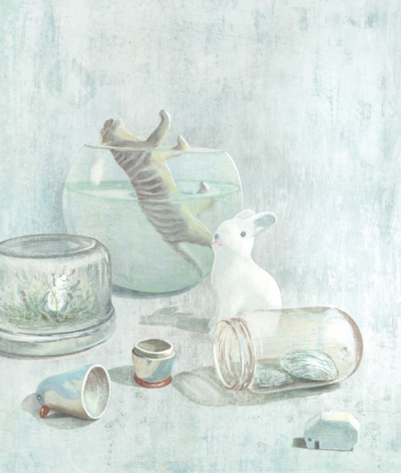
Er zijn alleen maar witte dieren in het grote witte land.