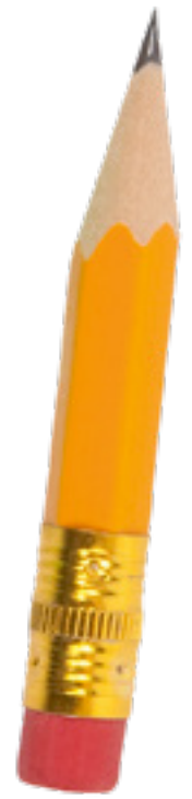
Gummetje dat achterop een potlood zit